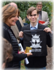
Besuch der Ministerpräsidentin im Schulgarten

In der eigenen Oberstufe (Mainzer Studienstufe – kurz: MSS) können unsere Lernenden den gymnasialen Bildungsgang beenden und bei uns ihr Abitur machen. Die in der Sekundarstufe I erworbenen methodischen Fähigkeiten werden weiterentwickelt und um Kompetenzen erweitert, die sowohl für ein Hochschulstudium als auch für das spätere Berufsleben von grundlegender Bedeutung sind. Projekte und eine Studienfahrt in das europäische Ausland sind fest konzeptionell verankert. Am Ende des Weges durch die MSS steht die Allgemeine Hochschulreife. Zudem besteht die Möglichkeit, das Lateinum zu erwerben.