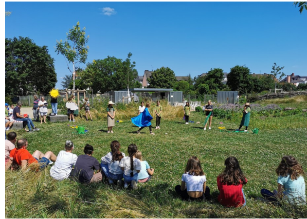
Theaterarbeit im Schüler-Park

Die IGS Koblenz ist hervorragend an den ÖPNV angebunden und so mit dem Bus gut und sicher zu erreichen.