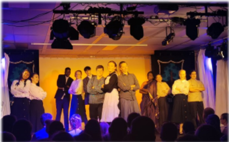
Theaterhelden - unsere Theater-AG