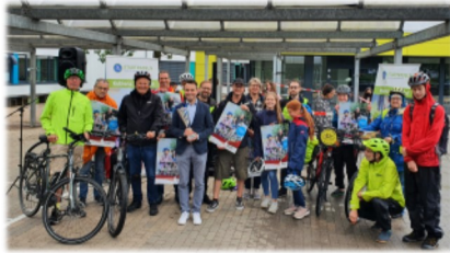
Besuch des Oberbürgermeisters